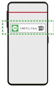
電話もかけられます